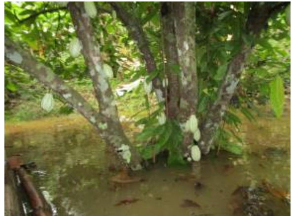
INUNDADO POR EL PHBB