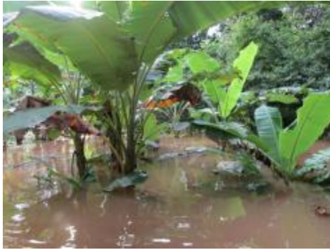
CULTIVOS INUNDADOS POR EL PHBB