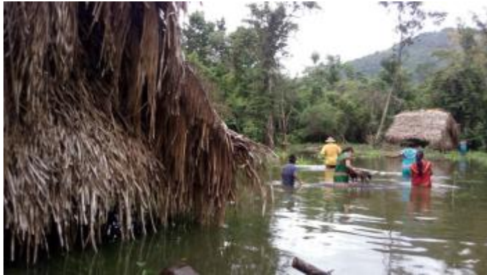
CASA INUNDANDOSE POR EL EMBALSE PHBB