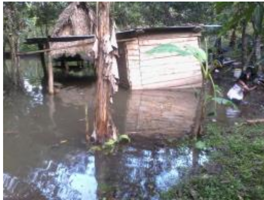
REPRESIÓN POR PHBB GUALAQUITA BOCAS DE TORO